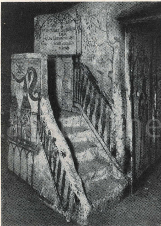
De nog intact zijnde preekstoel, „in den levenden steen” gehouwen.

Donkere schuilhoek tevens, waar de geoloog in de krijtlagen en vervormingen de overblijfselen vond van voorwereldlijke dieren, doch waar óók in een onderaardsche kapel een blijvend gedenkteeken wordt aangetroffen der bewoners, die gedurende den orkaan der Fransche omwen-