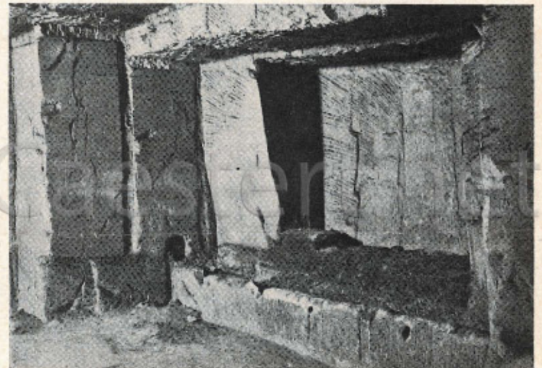
Eén der veestallen in de catacomben van Berg-Terblijt, waar de boeren met hun vee een schuilplaats vonden tijdens de Fransche overheersching.

Deze weinig bekende catacomben te Geulhem, gemeente Berg-Terblijt, mogen gelden voor een der meest interessante monumenten der oudheid; de verlaten schuilplaatsen der oude Limburgers zijn nog ongerept gebleven — zij vormen in hun verheven eenvoud een aangrijpende herinnering aan het tijdperk der Fransche overheersching in Limburg, welke van groote geschiedkundige waarde is.