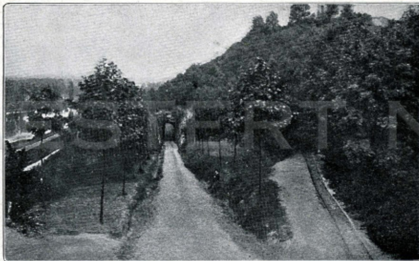
Een foto van een paar jaar geleden, die ongeveer hetzelfde punt weergaf als de kiek boven. Men ziet rechts boven de ruïne Lichtenstein in 't groen zooals we die vroeger zagen. De vergelijking met de bovenste kiek die we dezer dagen maakten, is welsprekend.