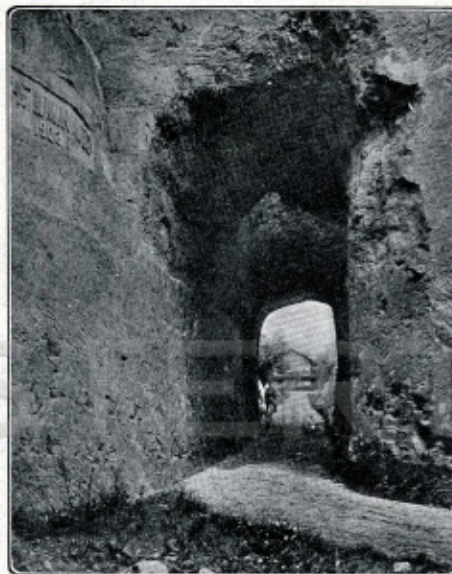
De schoone Wilhelminaweg met uitzicht op 't Chalet.... dit alles is al verdwenen.